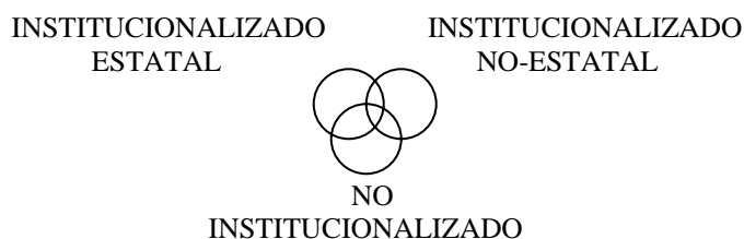
Fig. 3. Ambitos de acción de actores en la construcción de políticas ambientales

Frente a ese modelo es posible plantear una alternativa que se basa en las prácticas políticas, asumiendo de esta manera una posición inversa, en la cual el mercado puede ser un tipo de relación social de los múltiples que se encuentran en la sociedad, y por lo tanto, regulado socialmente. En este caso se distinguen tres ámbitos de acción política (Fig. 3): el institucionalizado Estatal (como ministerios, municipios, universidades estatales), el institucionalizado no-Estatal (asociaciones empresariales, universidades, órdenes religiosas, etc., y el no-institucionalizado propio de los nuevos movimientos sociales (ver también GUDYNAS, 2001; el calificativo de institucionalización se corresponde con las concepciones de OFFE, 1988). Obsérvese que los tres ámbitos son políticos sensu lato , y eso los convierte en la mejor aproximación para considerar la construcción de políticas ambientales. Estos ámbitos comparten un mismo nivel, no existe un espacio por sobre el otro, y las categorías son análogas entre ellas. Asimismo, en este modelo existen amplias superposiciones, no sólo dada por la moviidades de los actores (pertenencias y acciones múltiples), sino por relaciones estrechas mediadas por actividades específicas, donde el caso más claro son las vinculaciones que establecen los partidos políticos hacia el Estado.