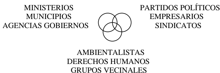
Fig. 4. Actores destacados en los tres ámbitos reconocidos para las políticas ambientales.

Volviendo a la ubicación de los actores colectivos, es posible acomodar los actores destacados en esos ámbitos de acción, ofreciendo la posibilidad de detectar nuevos actores y de ubicar a los que sucesivamente se van identificando. En la Fig. 4 se ofrece un primer agrupamiento como una guía. En el espacio institucionalizado Estatal se destacan los políticos profesionales, legisladores, técnicos y administrativos. En el espacio no-Estatal se encuentran tanto los militantes de los partidos políticos, como las corporaciones y viejos movimientos sociales que apelan a acciones políticas institucionalizadas, con canales conocidos de participación y acción, e incluso consulta o cogestión con el Estado en algunos aspectos.